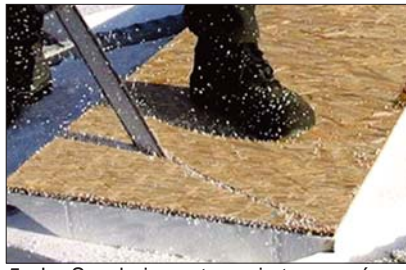
5 - Le Seacbois peut aussi être coupé en biais.