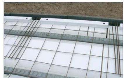
15 - L'ajout d'une bande de polystyrène 8x5 cm permet d'obtenir un \Psi de 0,14.