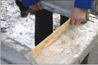
1 - Poser les poutrelles, ajuster l'entraxe grâce aux tympons.