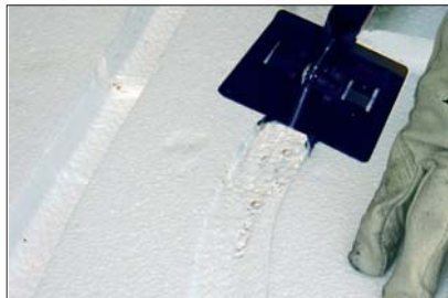
8 - Faire des saignées dans le Seacbois grâce au Canalcut.