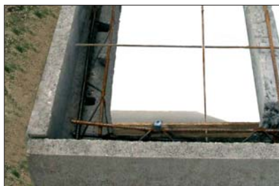
14 - Le Seacbois fait office de rupteur thermique.