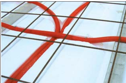
10 - Poser le treillis métallique.