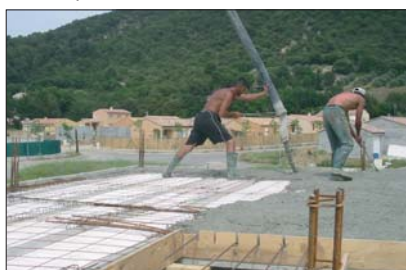
17 - Couler la dalle.