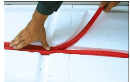
9 - Placer les gaines dans les saignées.