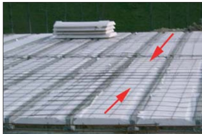
11 - Serrer les Seacbois.