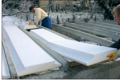
2 - Faire glisser les Seacbois sur le talon des poutrelles.