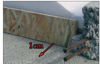
12 - Incliner les tympons de 1 cm environ pour une bonne tenue lors du coulage du béton.