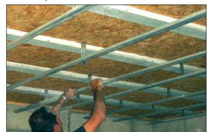
18 - Fixer les faux plafonds.