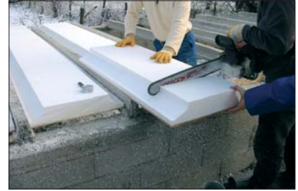
3 - Poser un Seacbois en bout de travée pour ajustement.