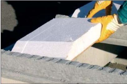
4 - Utiliser la chute pour démarrer la travée suivante (pas de pertes).