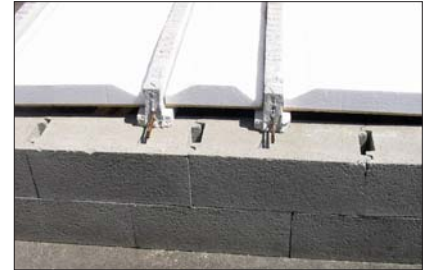
6 - Le Seacbois s'adapte à toute largeur d'entraxe en le coupant en long.