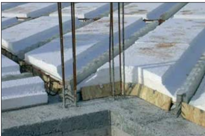
7 - Les tympons doivent être placés en bout de travées.